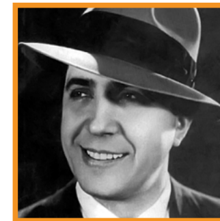
CARLOS GARDEL / Tolosa 1890 / Medellín 1935