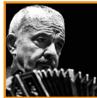
ASTOR PIAZZOLLA / Mar del Plata 1921 / Buenos Aires 1992