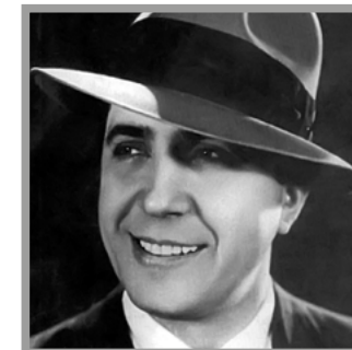
CARLOS GARDEL / Tolosa 1890 / Medellín 1935