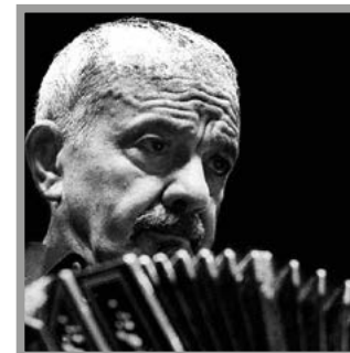
ASTOR PIAZZOLLA / Mar del Plata 1921 / Buenos Aires 1992