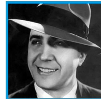
CARLOS GARDEL / Tolosa 1890 / Medellín 1935