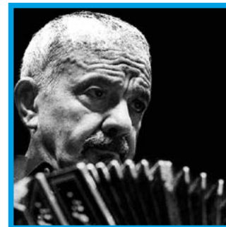
ASTOR PIAZZOLLA / Mar del Plata 1921 / Buenos Aires 1992